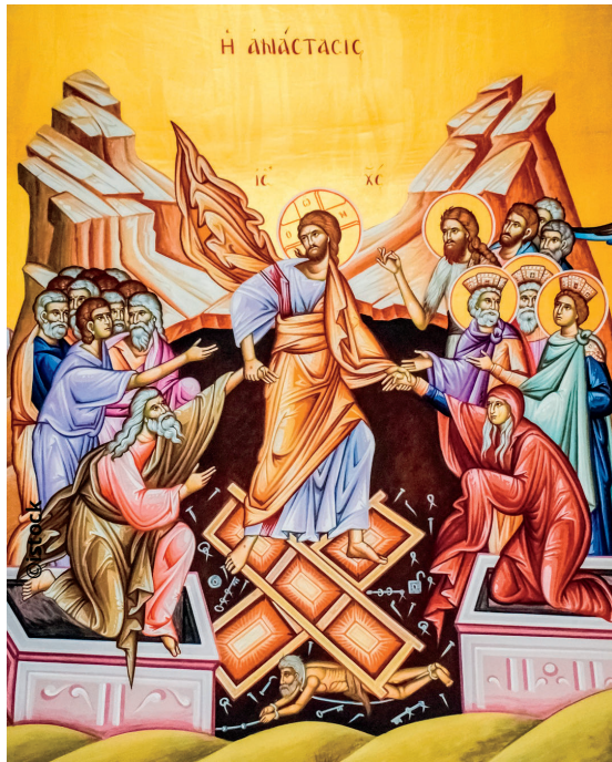
icône de la Résurrection

« Il fallait que Jésus ressuscite d'entre les morts »