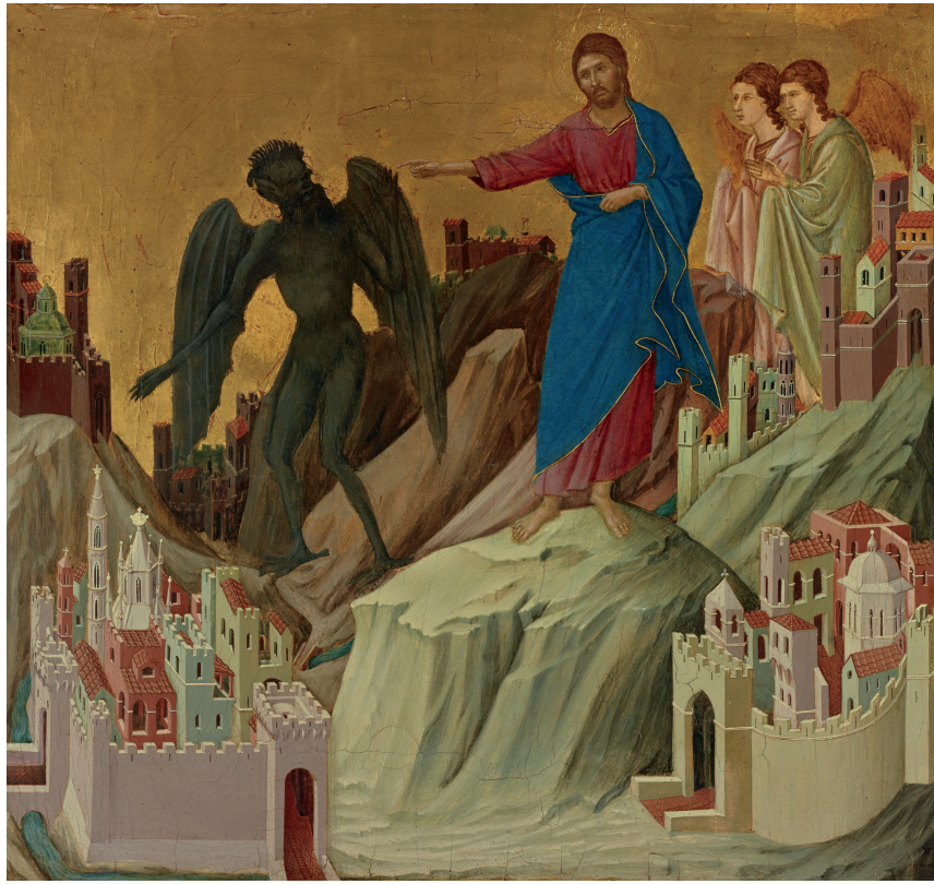
Duccio - The Temptation on the Mount - Par Duccio di Buoninsegna - Web Gallery of Art - Image Info about artwork, Domaine public, httpscommons.wikimedia.org/index.php?curid=3207996

Écouter la Parole c'est aussi découvrir quelque chose dans le texte que je ne connaissais pas de moi-même.